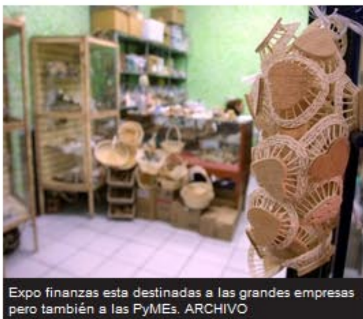
Expo finanzas esta destinada a las grandes empresas pero también a las PyMEs.